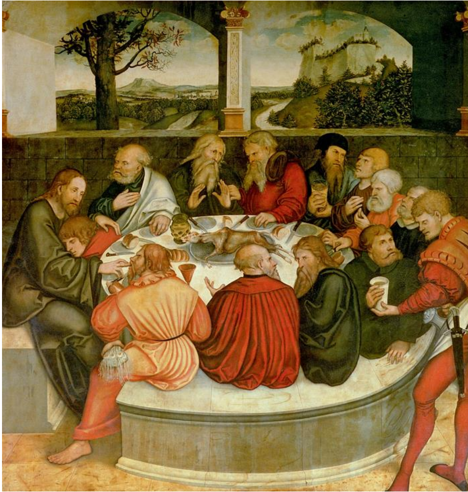
Bartholomäus Bernharti im Kreise bedeutender Reformatoren auf dem zentralen Altarbild „Das Abendmahl“ des Reformationsaltars von Lucas Cranach d.Ä. (1547) in Wittenberg. Bernharti in roter Kleidung hinten mit der Hand auf einem Teller.