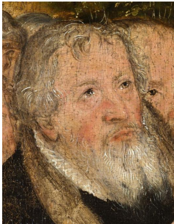
Bartholomäus Bernhardi auf einem Altarbild von Lucas Cranach d.J. (1565) in seiner Pfarrkirche zu Kemberg, in der er öffentlich geheiratet hat.

Dass Bartholomäus Bernhardi tatsächlich zur ersten Garde der Reformatoren rund um Luther und Melanchthon gehörte, manifestiert sich besonders darin, dass er auf mehreren Gemälden und Holzschnitten der beiden Lucas Cranach, dem Älteren und dem Jüngeren, im engsten Kreise der Reformatoren aufscheint, sei es in Abendmahlszenen oder bei der Taufe Christi.