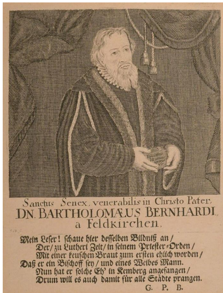
Kupferstich Bartholomäus Bernhardi von Johann Christoph Boecklin 1703

Der erste öffentlich verheiratete Priester der Reformationszeit, Bartholomäus Bernhardi (1487-1551), stammt aus Vorarlberg. Der Tag seiner öffentlichen Vermählung, der 24. August 1521, wird in der evangelischen Kirche traditionellerweise als „ Diem liberationis Pastorum “ gefeiert, als „ Erlösungstag der Prediger “. Dieser jährt sich heuer zum 500. Male. Bernhardi gilt als der Begründer des evangelischen Pfarrhauses.