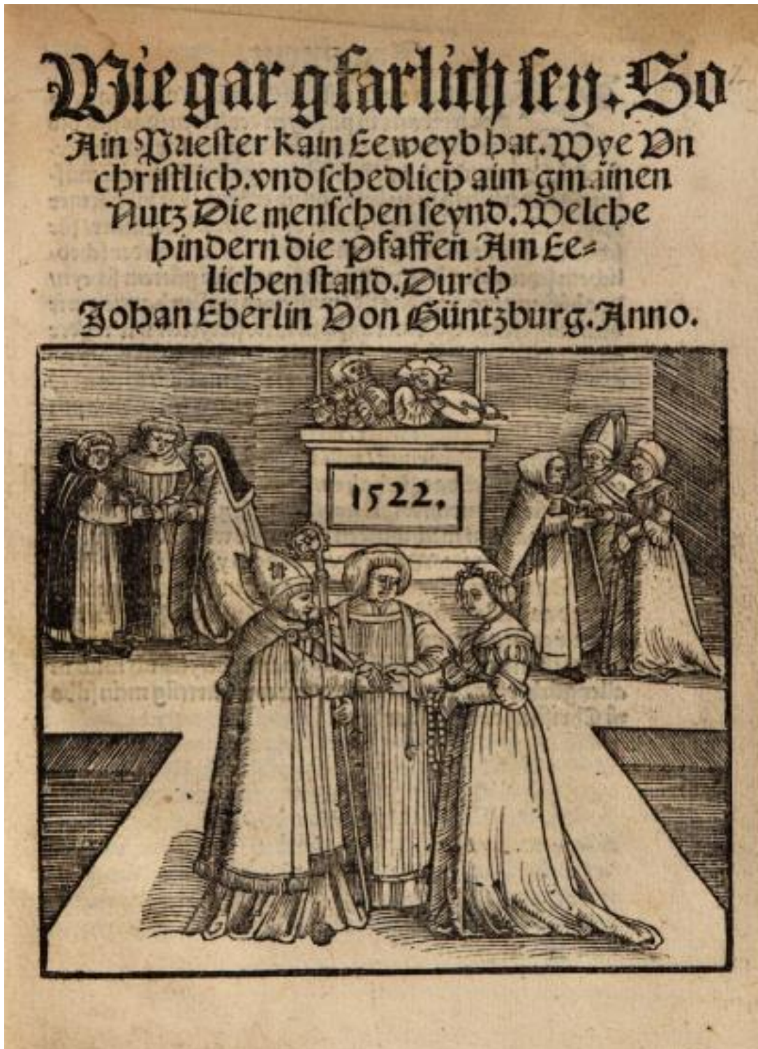
Titelseite einer weiteren Streitschrift für die Priesterehe von Johan Eberlin von Güntzburg 1522